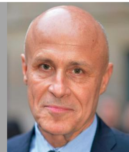
Olivier POIVRE D'ARVOR

Ambassadeur chargé des pôles et des océans